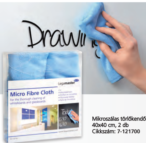
Mikroszálás törölkendő 40x40 cm, 2 db Cikkszám: 7-121700