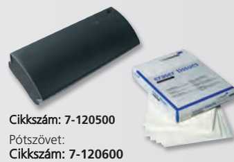
Cikkszám: 7-120500 Pótszövet: Cikkszám: 7-120600