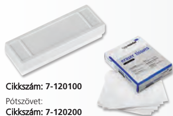
Cikkszám: 7-120100 Pótszövet: Cikkszám: 7-120200